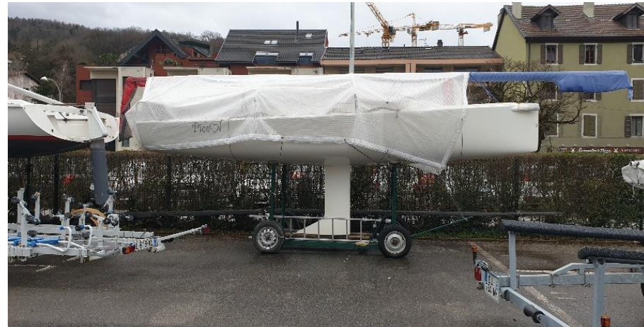
Figure 2- Quille position navigation

Le Transport du bateau sera assuré avec le fourgon de la Ligue.