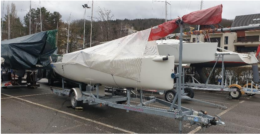
Figure 1- Quille position Transport